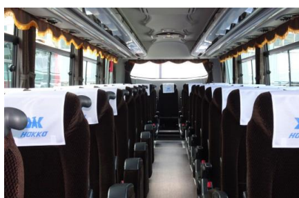
① 快適な空間を彩るブラウン基調のシート