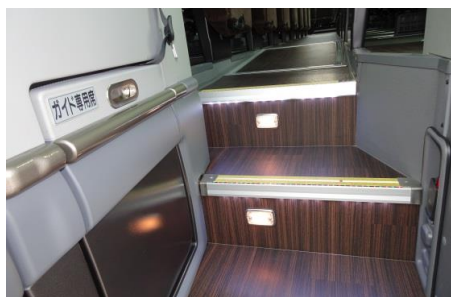
④ ダークブラウンの木目調フローリング