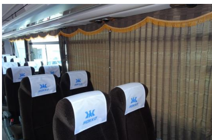
② 落ち着いた色あるオリジナルカラーのカーテン