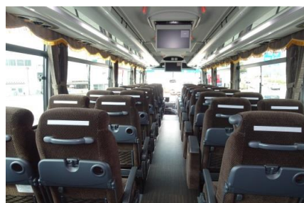
③ 前方26inch後方18.5inch71吋モニター